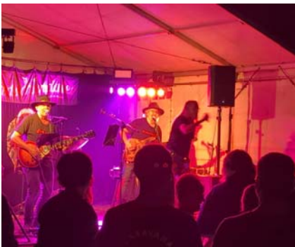
Rock an der Lok